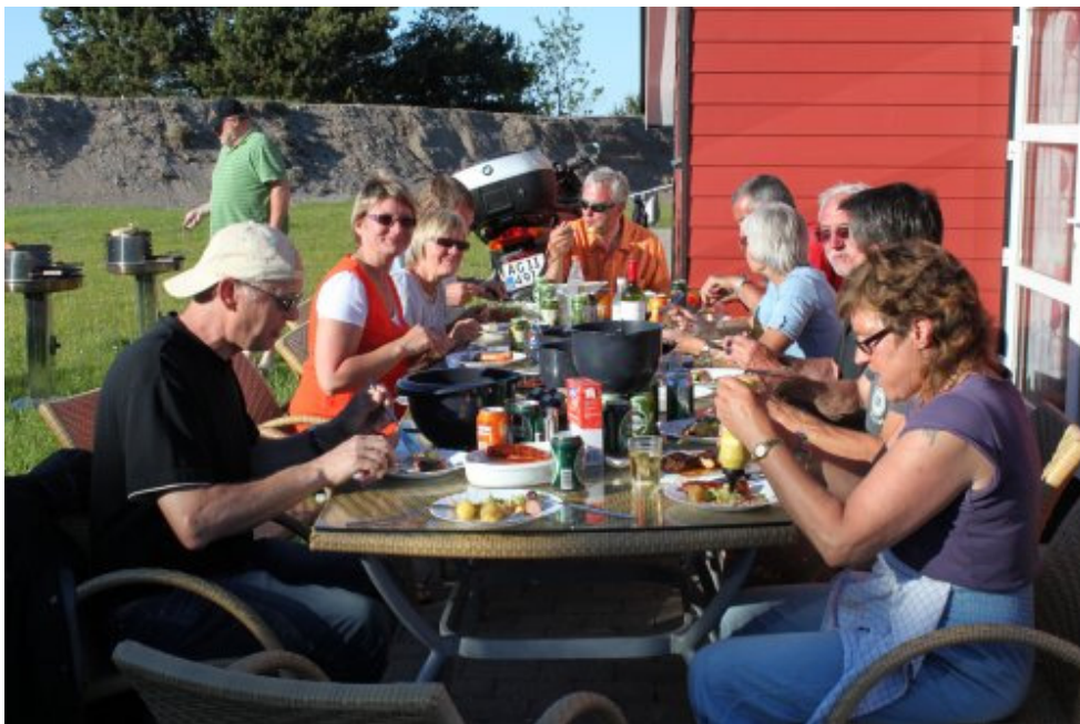
Fælles grill bag hytterne på campingpladsen.